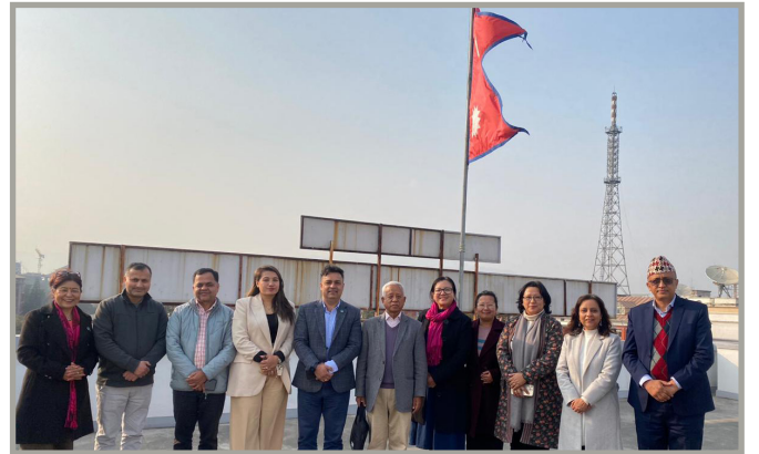
श्रम, रोजगार तथा सामाजिक सुरक्षा मन्त्रालयमा श्रम नीति सम्बन्धि बैठक