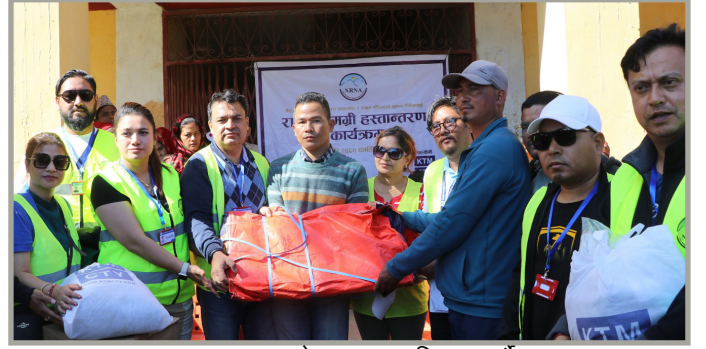
जाजरकोटमा राहत बितरण गर्दै