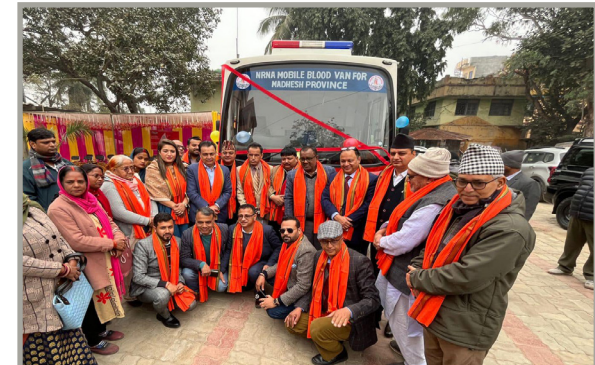
मधेश प्रदेशमा मोबाईल बस हस्तान्तरण