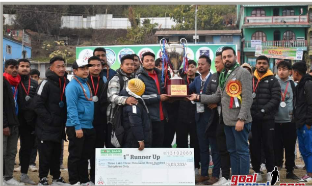
एनआरएनए इलाम गोल्डकपको उपाधी वितरण