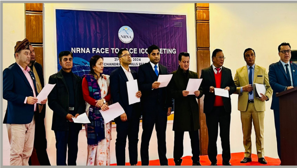
एनआरएनए आईसीसी सदस्यले लिए पद तथा गोपनीयताको शपथ लिदै