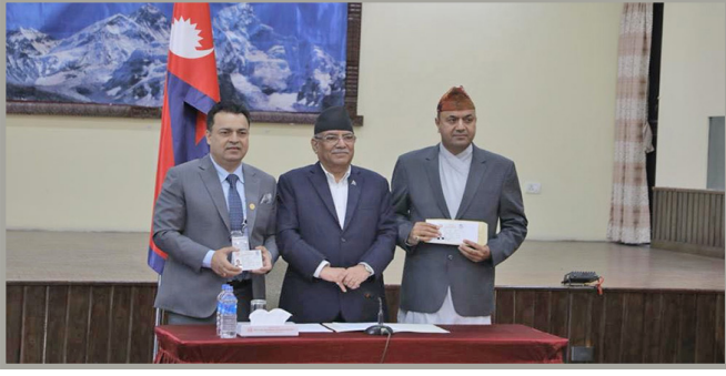
पहिलो गैरआवासीय नेपाली नागरिकता प्रधानमन्त्रीज्युको हातबाट लिदै