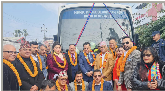
कोशी प्रदेशमा मोबाईल बस हस्तान्तरण