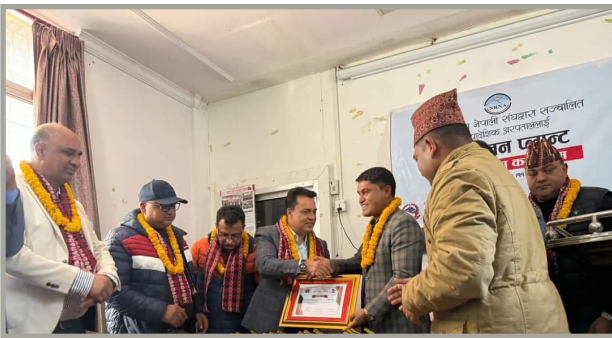
सेती प्रादेशिक अस्पताललाई अक्सिजन प्लान्ट हस्तान्तरण कार्यक्रम