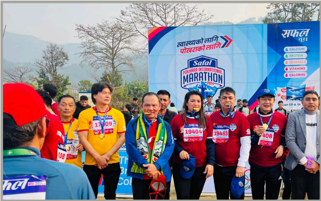
सफल पोखरा म्याराथनमा सहभागी हुदै