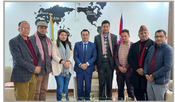
सुदूरपश्चिमका आर्थिक मामिला मन्त्री एनआरएनए मुख्यालयमा, लगानीबारे छलफल