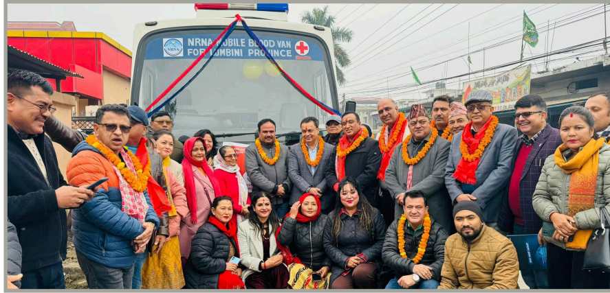
नेपालगञ्जमा मोबाईल बस हस्तान्तरण