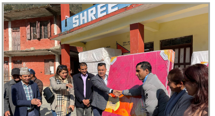
सिधुपाल्चोक श्री बाल शिक्षा विधालयमा विद्यार्थीहरूलाई म्याट्रेस वितरण