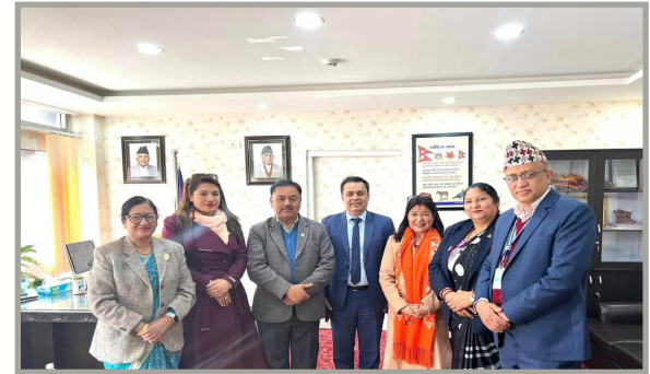
महिला बालबालिका तथा ज्येष्ठ नागरिक मन्त्रीसंग भेटघाट