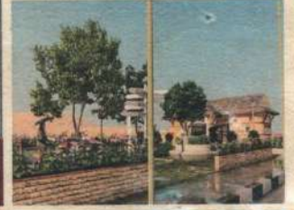
अत्याधुनिक सार्वजनिक शौचालय र चमेना गृह