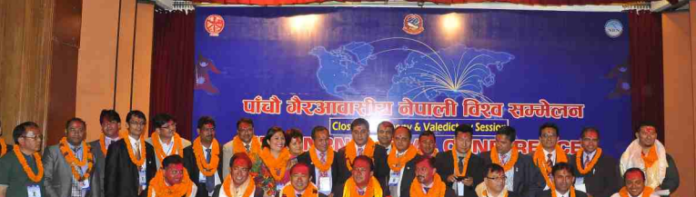
Newly Elected Office Executive Members (5 th NRN Global Conference-2011)

नेपाल र गैरआवासीय नेपालीहरुका सरोकारका विषयहरुमा वृहत रुपमा छलफलको अवसर दिदै नेपाल सरकार र सरोकारवालाहरूसंग सहकार्य र समन्वय गरी गैरआवासीय नेपालीहरुको राष्ट्र निर्माणमा सहभागीता अभिवृद्धि गराउनमा विश्व सम्मेलनले उल्लेखनीय भूमिका निर्वाह गर्दै आएको छ। गैरआवासीय नेपालीहरुका लागि यो सम्मेलन आफ्नो मुलुकसंग भावनात्मक रुपमा गाँसिने पर्वको रुपमा परिचित छ। गैरआवासीय नेपाली संघ स्थापनाको एक दशक पुरा भएको अवस्थामा हुन गर्दरहेको यस सम्मेलनको महत्त्व एवं गरिमा अफ्न बढी भएको छ।