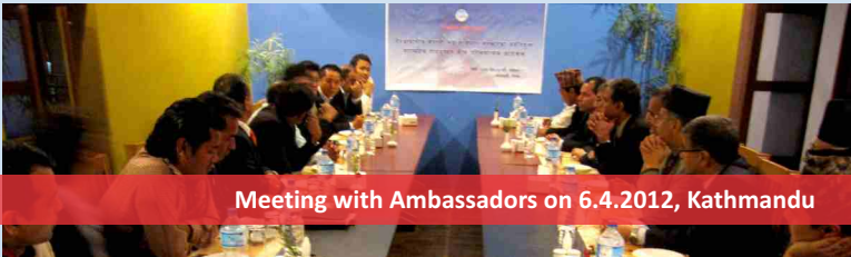
Meeting with Ambassadors on 6.4.2012, Kathmandu

Pre and post conference activities are also to be conducted on issues that are not directly taken up in the main conference.